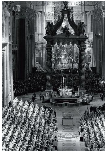
De opening van het Tweede Vaticaans Concilie op 11 oktober 1962 te Rome

In 1967 werd de Intermonasteriële Werkgroep voor Liturgie opgericht, die het Abdijboek publiceerde met gezangen, antifonen en acclamaties voor de Nederlandstalige getijdenliturgie bin-