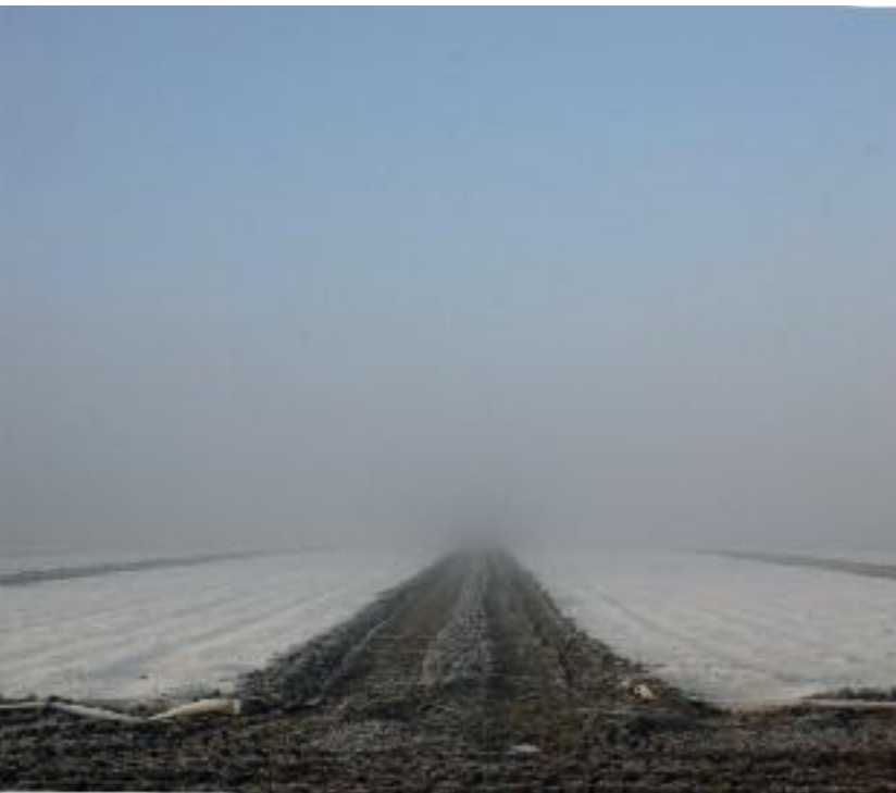
Voor de derde dag: bloembollenteelt Zeeland

hemel, aangeduid in het Hebreeuws als sjemee hasjamajim , waarover we lezen in Psalmen (148:4): Looft Hem, hemel der hemelen, en wateren boven de hemel (zie ook Neh. 9:6). Hiermee is de hemel waarvan al in het eerste vers werd gesproken gereed.