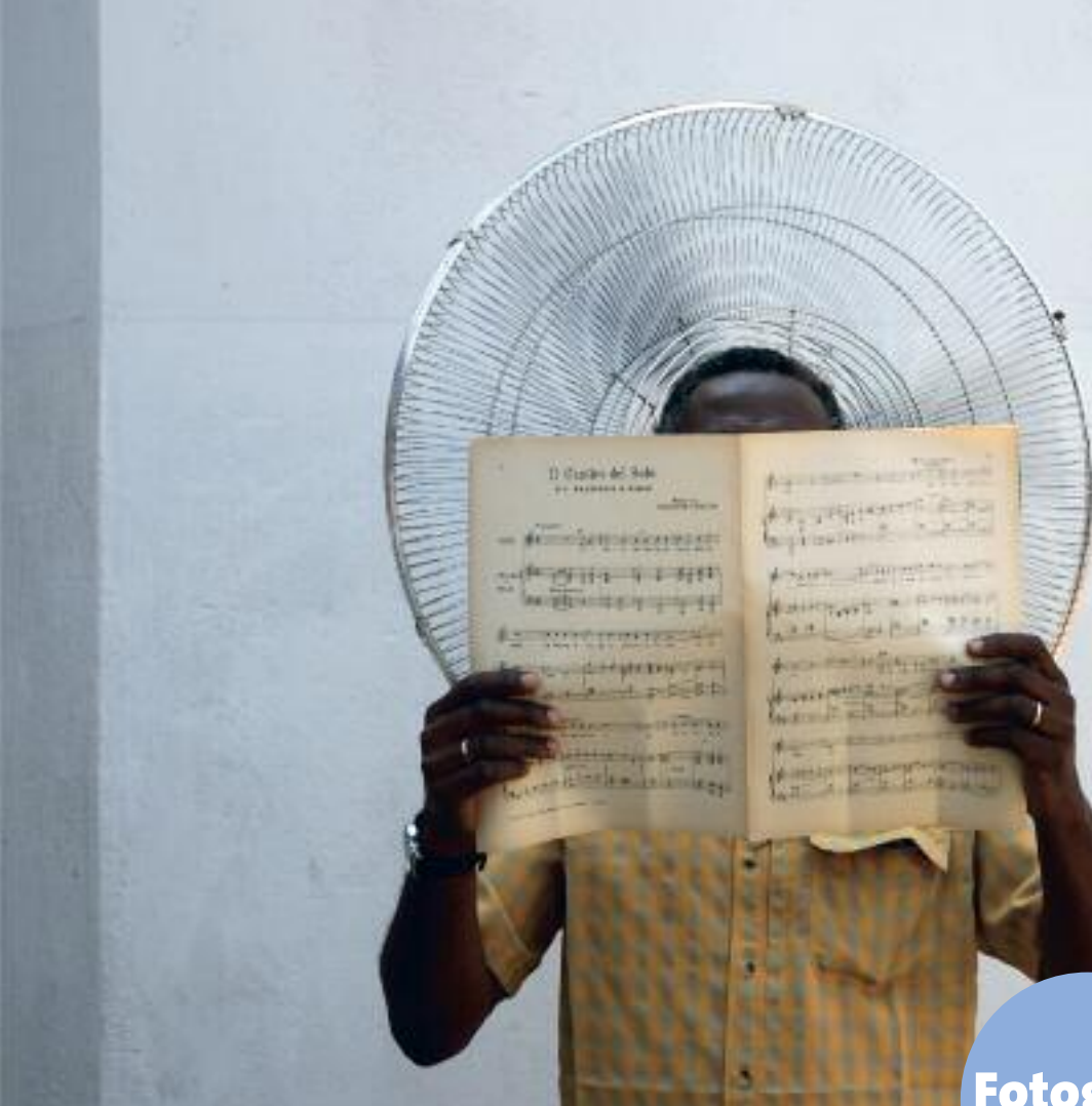
Il Cantico delle Creature (gezang 400 uit het Liedboek voor de Kerken), uit Yoyo mama yo