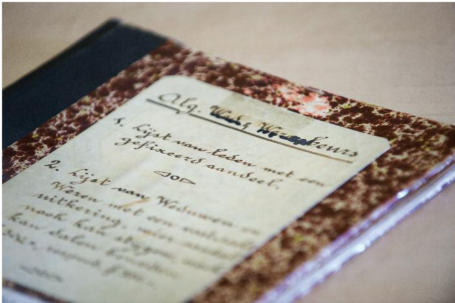
Deel van het register van de Algemeene Weduwen- en Weezenbeurzen, 1821-1945.

Om de inkomenspositie van weduwen te verbeteren ontstonden er in de achttiende eeuw zogenoemde weduwebeurzen. Het waren vooral mensen uit de gegoede burgerij, zoals artsen, schoolmeesters, kooplieden, ambtenaren en